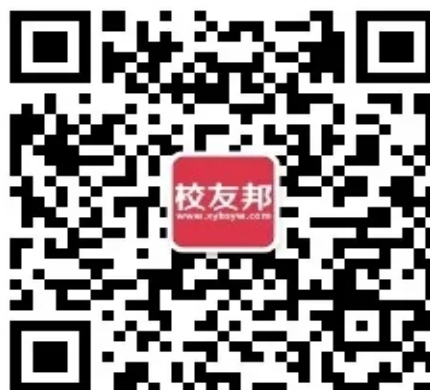
校友邦教师版公众号二维码

以上操作过程中，如有疑问，可联系校友邦对应老师或在线客服，电话：0579-82722068